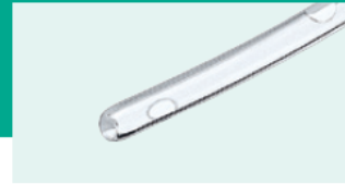
Extremo redondeado con orificios laterales