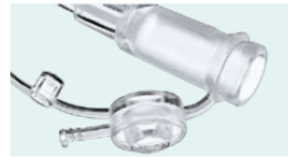
Conexión en embudo