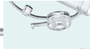
Tapón con conexión Luer

antes y después de administrar comida –o cada 4/8 horas– la sonda debe ser aclarada con agua a temperatura corporal. Las sondas atascadas pueden desatascarse con bebidas carbónicas. El aclarado debe realizarse con cuidado, usando una presión adecuada.