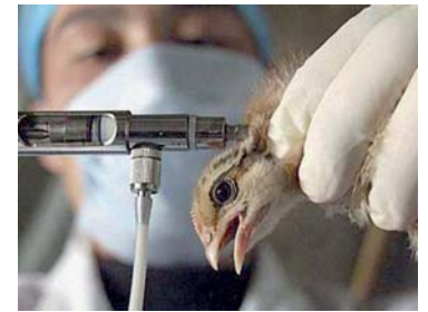
Caja 12 agujas

Doble bisel facilitando una mejor entrada en la piel y apenas dejando señales de pinchazo una vez se extrae la aguja.