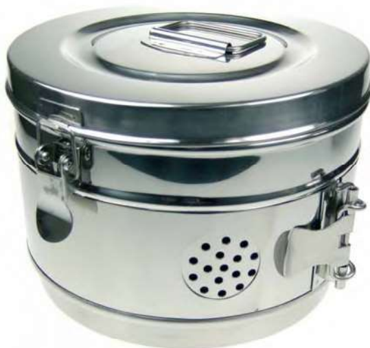
BOMBONAS CHARNELA Realizadas en acero inoxidable, para esterilización.