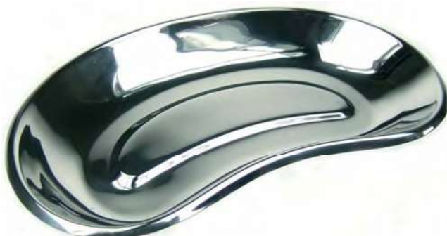
CUBETAS CON FORMA DE RIÑÓN PARA INSTRUMENTAL