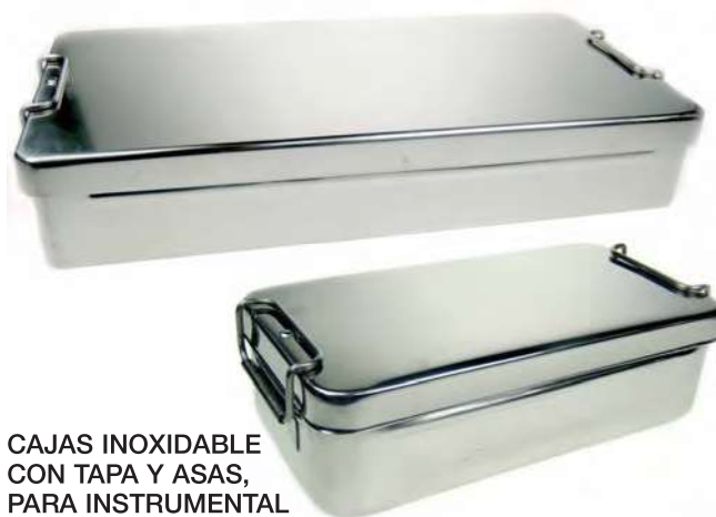
CAJAS INOXIDABLE CON TAPA Y ASAS, PARA INSTRUMENTAL

Interior del cuerpo y tapa tratados con chorro de microesferas. Exterior de cuerpo y tapa pulido brillo espejo.