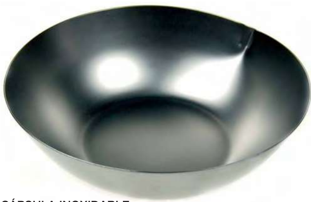
CÁPSULA INOXIDABLE B07654 Cápsula de 16 cm