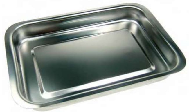
BANDEJAS EMBUTIDAS Realizadas en acero inoxidable.