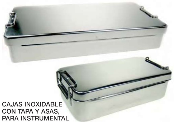
CAJAS INOXIDABLE CON TAPA Y ASAS, PARA INSTRUMENTAL Interior del cuerpo y tapa tratados con chorro de microesferas. Exterior de cuerpo y tapa pulido brillo espejo.