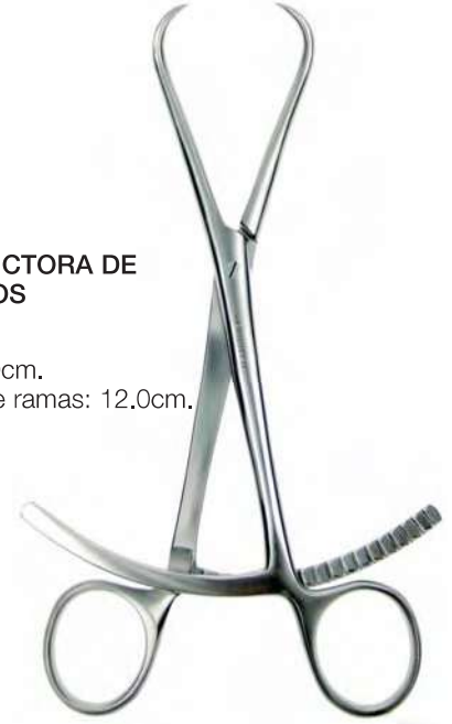
PINZA REDUCTORA DE FRAGMENTOS

Inoxidable, 13cm. Abertura entre ramas: 2.0cm.