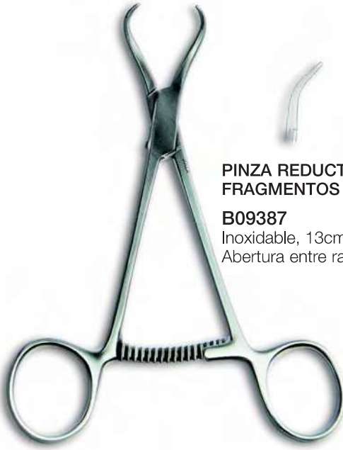
PINZA REDUCTORA DE FRAGMENTOS