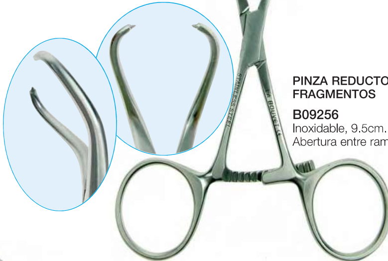
PINZA REDUCTORA DE FRAGMENTOS

Inoxidable, 20cm. Abertura entre ramas: 12.0cm.