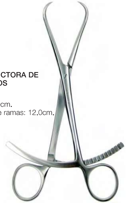
PINZA REDUCTORA DE FRAGMENTOS

B09387 Inoxidable, 13cm. Abertura entre ramas: 2.0cm.