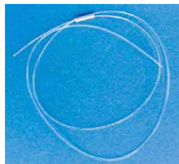
Detalle sutura con aguja

Conjunto estéril: hebra en LAZO con aguja montada y grapas.