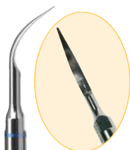
B08827 N° 1

N 10P: Con spray. Tratamiento interproximal y de las bolsas periodontales.