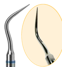
B08832 N° 10P