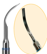
B08831 N° 2