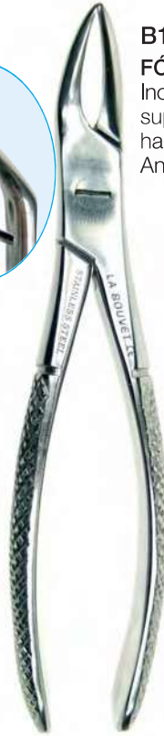
B16206 FÓRCEPS EXTRACTORS Inoxidable, para raíces y fragmentos superiores, bocas ranuradas, curvado hacia el frente, 16cm. Ancho boca: 2-3mm, cierre "total".