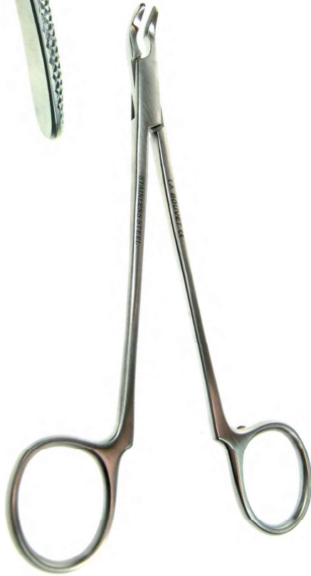
B09392 DENTAL ROEDORES Fórceps extractor, inoxidable, bocas estriadas, acodado al frente. 15,5cm ancho boca: 3mm, cierre "total".