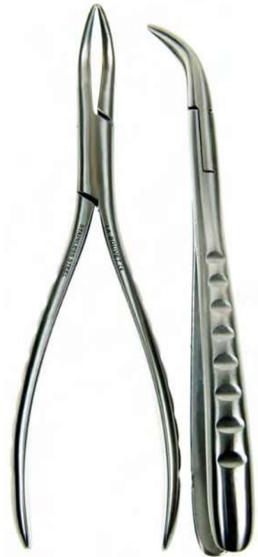
B16207 FÓRCEPS EXTRACTOR Inoxidable, para raíces y fragmentos inferiores bocas ranuradas, curvado hacia el frente, 16,5cm. Ancho boca: 2-3mm, cierre "total".