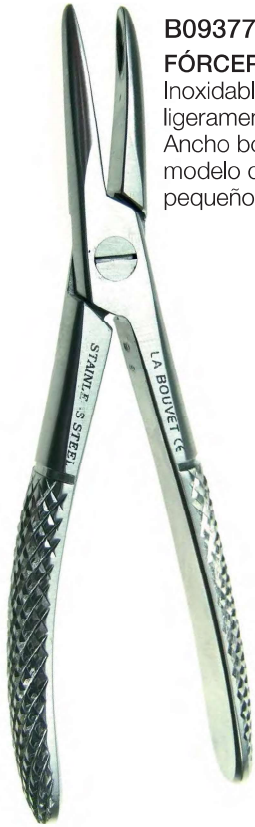
B09377 FÓRCEPS EXTRACTOR Inoxidable - boca ranurada - ligeramente curvado - 12cm. Ancho boca: 3mm cierre "total", modelo delicado para muy pequeños animales (gatos, ...).