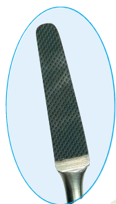
B16220 Raspador: 18.0cm. Dentado: corte transversal. Pala: TC-tungsteno 20mm x 5:3.