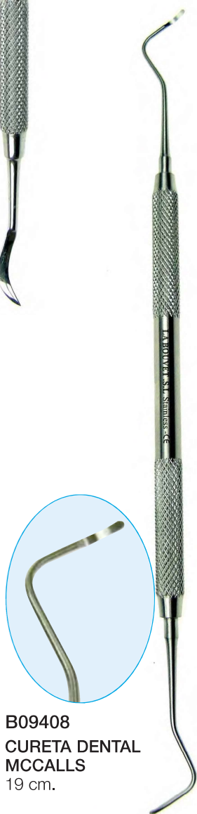
B09408 CURETA DENTAL MCCALLS 19 cm.