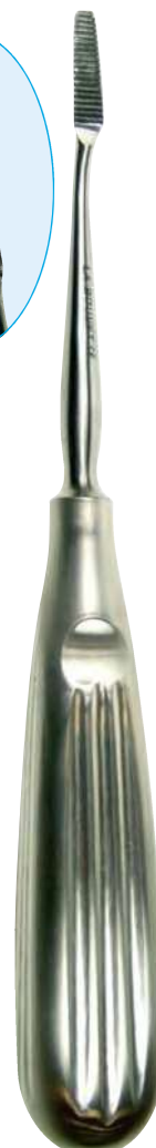
B16218 Raspador 18.0cm. Dentado: corte transversal. Pala: 20mm x 5:3mm.