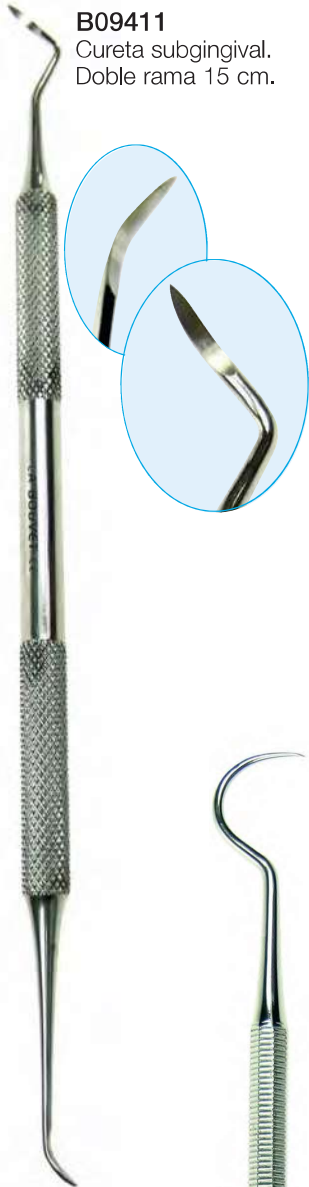
B09411 Cureta subgingival. Doble rama 15 cm.