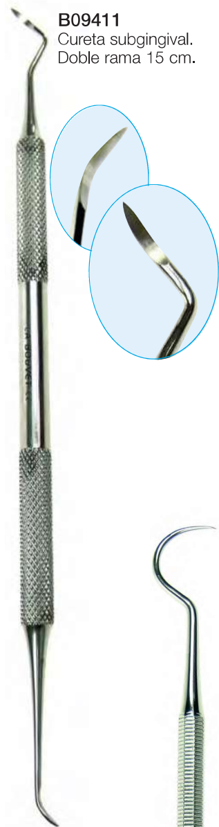
B09411 Cureta subgingival. Doble rama 15 cm.