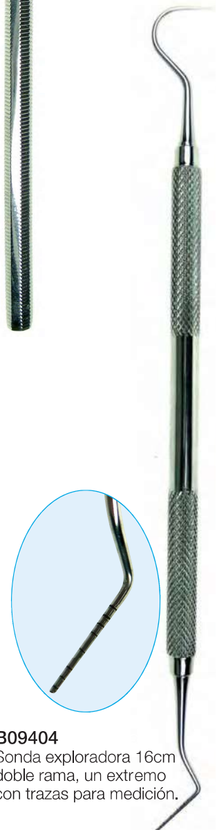
B09404 Sonda exploradora 16cm doble rama, un extremo con trazas para medición.