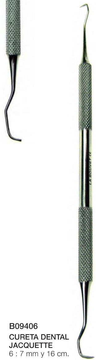
B09406 CURETA DENTAL JACQUETTE 6 : 7 mm y 16 cm.