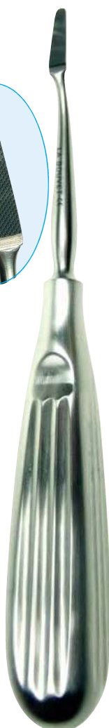
B16220 Raspador: 18.0cm. Dentado: corte transversal. Pala: TC-tungsteno 20mm x 5:3.