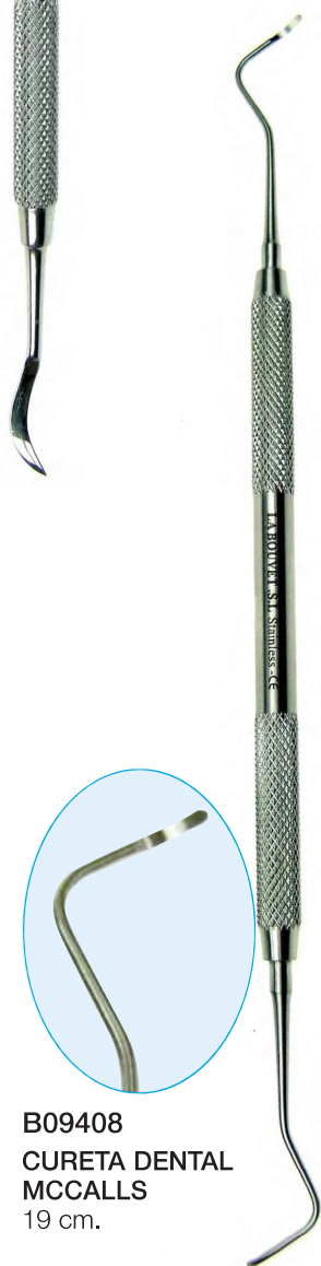
B09408 CURETA DENTAL MCCALLS 19 cm.