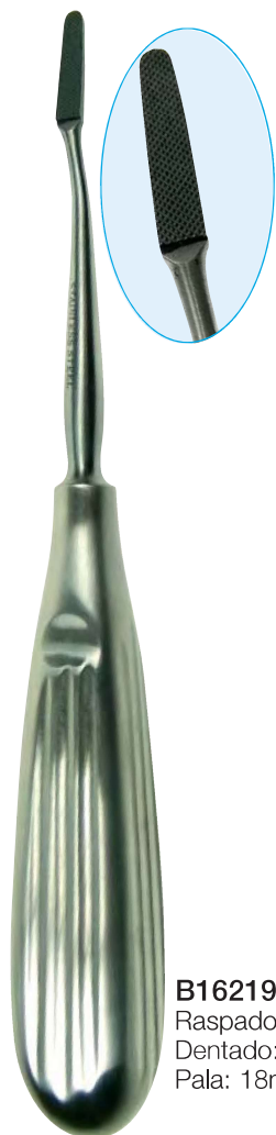
B16219 Raspador 18.0cm. Dentado: fino en cruz. Pala: 18mm x 5:3mm.