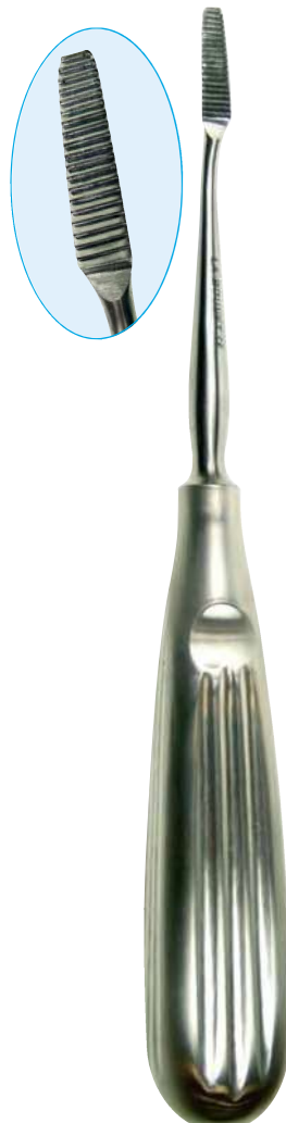
B16218 Raspador 18.0cm. Dentado: corte transversal. Pala: 20mm x 5:3mm.