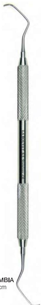
B09407 CURETA COLUMBIA Doble rama. 17 cm