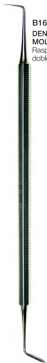
B16231 DENTAL ROEDORES MOLARES Raspador, explorador, elevador, doble rama 15,5cm.