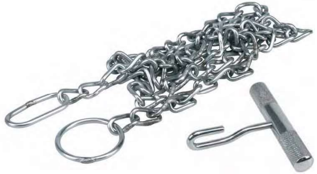
CADENAS PARA PARTOS Acero inoxidable. B09191 75cm B09192 150cm B09193 Mango para cadenas obstétricas