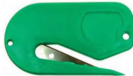
B07192 CUCHILLOS Para cesáreas.