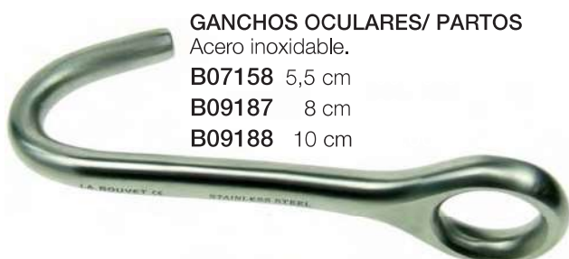
GANCHOS OCULARES/ PARTOS Acero inoxidable.