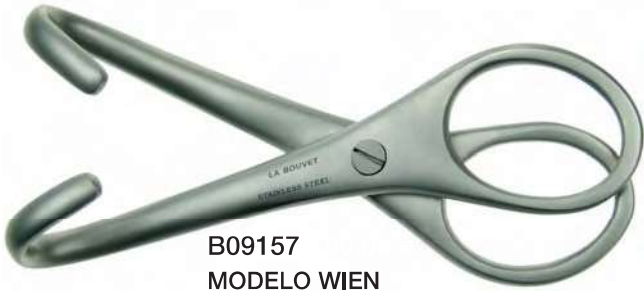
B09157 MODELO WIEN Ramas romas, 14.5cm.