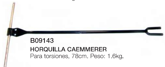
B09143 HORQUILLA CAEMMERER Para torsiones, 78cm, Peso: 1.6kg.