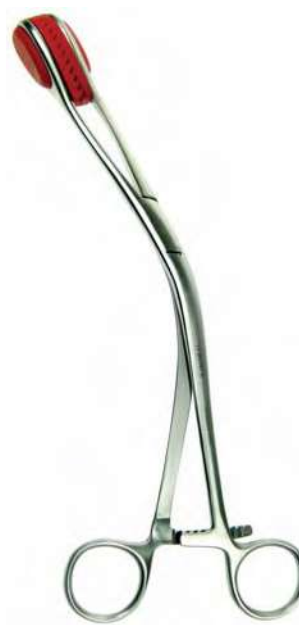
B07429 Aros caucho, 29cm.