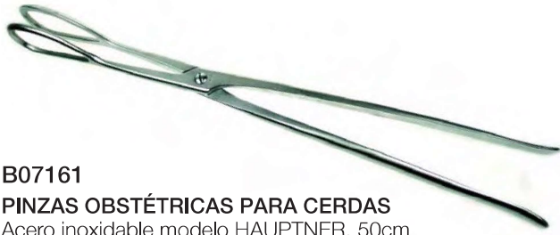
B07161 PINZAS OBSTÉTRICAS PARA CERDAS Acero inoxidable modelo HAUPTNER, 50cm.