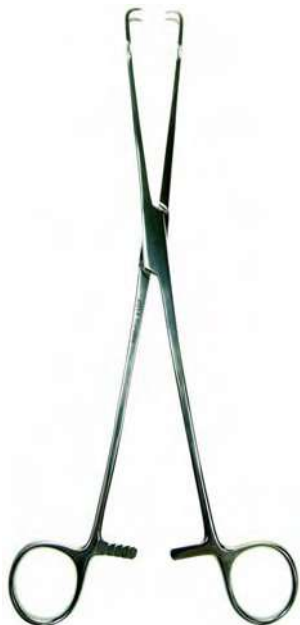
B09013 2X2 garfios, 24cm.