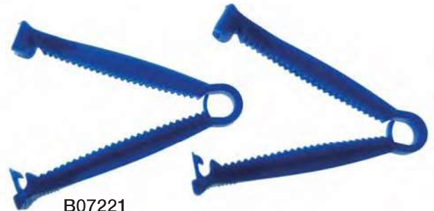
B07221 CLAMP UMBILICAL 10,5cm material desechable.