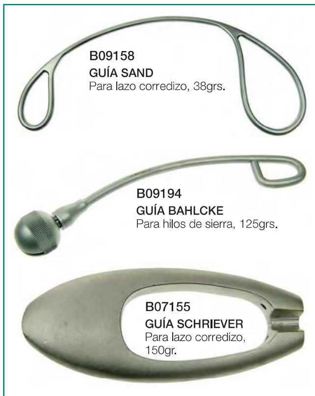
B09158 GUÍA SAND Para lazo corredizo, 38grs.