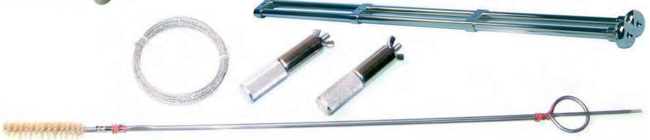
B07163 EMBRIOTOMO GÖTZE HAUPTNER , completo con todos los accesorios.