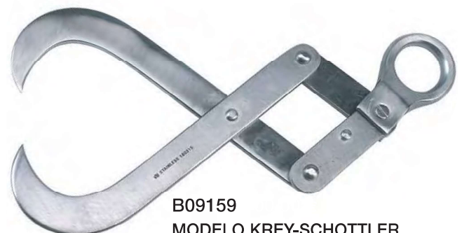
B09159 MODELO KREY-SCHOTTLER Articulado, ramas agudas. medidas 15:21cm.