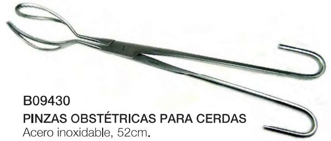
B09430 PINZAS OBSTÉTRICAS PARA CERDAS Acero inoxidable, 52cm.