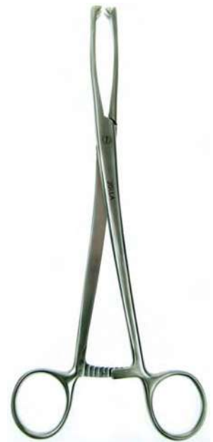
B09427 MUSEUX 2x2 dientes, 24cm.