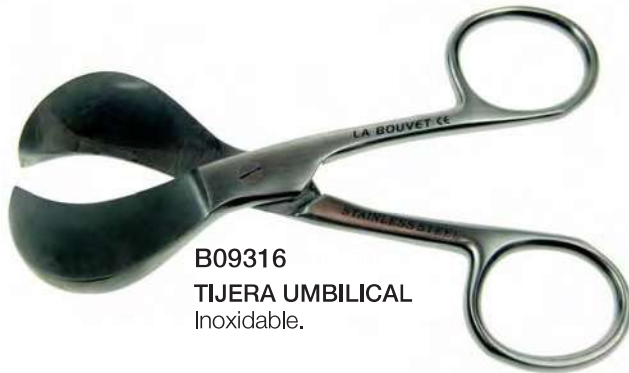
B09316 TIJERA UMBILICAL Inoxidable.