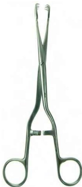
B09341 4x4 garfios, 26cm.