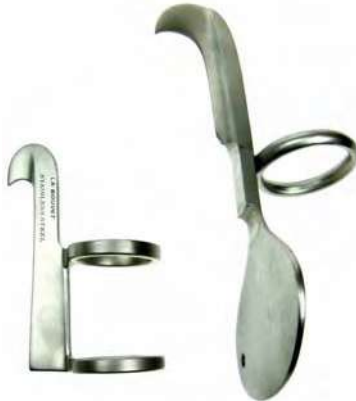
EMBRIOTOMÍAS Cuchillos acero inoxidable. B09195 GÜNTHERS ligero doble anillo, 6.5cm. B09431 LINDE anillo-palmar, 12cm.