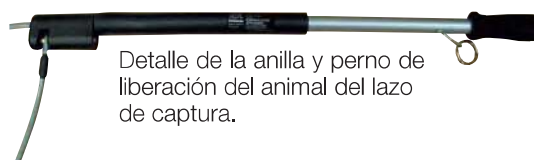
Detalle de la anilla y perno de liberación del animal del lazo de captura.

Cuando es necesario que el operario meta al perro en una camioneta o en una perrera, el rápido mecanismo de liberación se puede activar tirando de la anilla, liberando instantáneamente al animal en un entorno seguro.