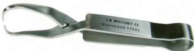
PINZAS SCHAEDEL AUTOCIERRE