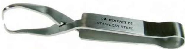
PINZAS SCHAEDEL AUTOCIERRE