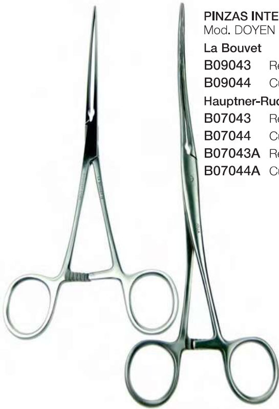
PINZAS INTESTINALES Mod. DOYEN