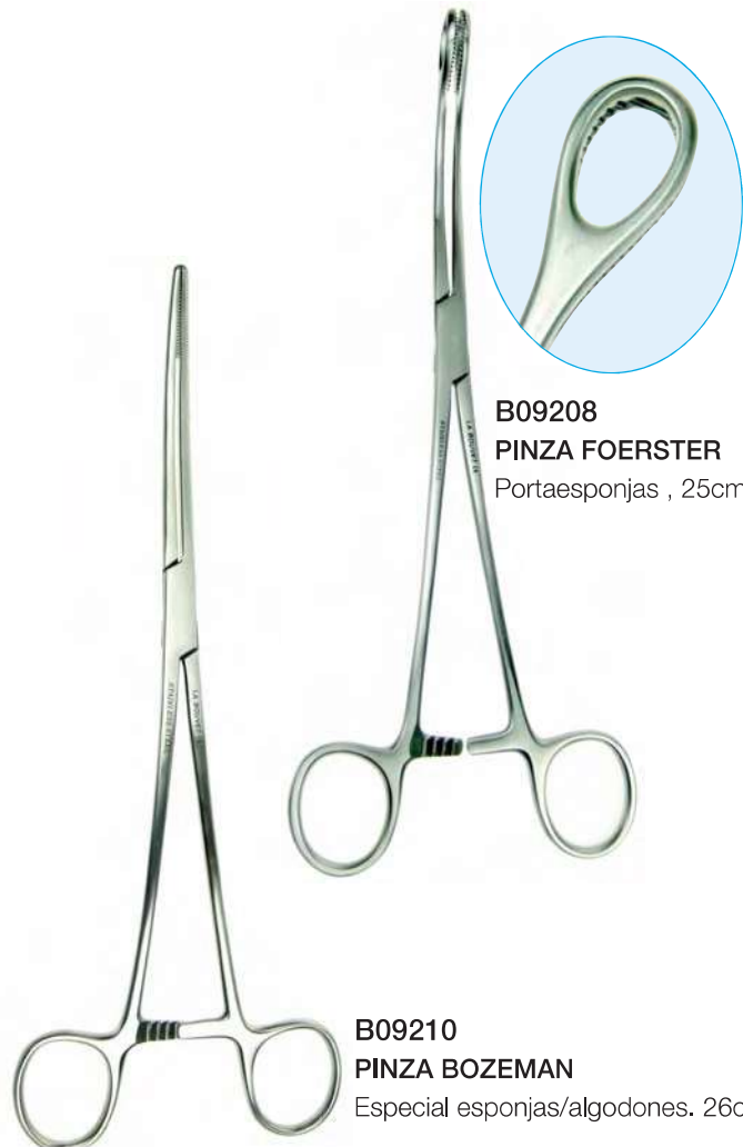
B09208 PINZA FOERSTER