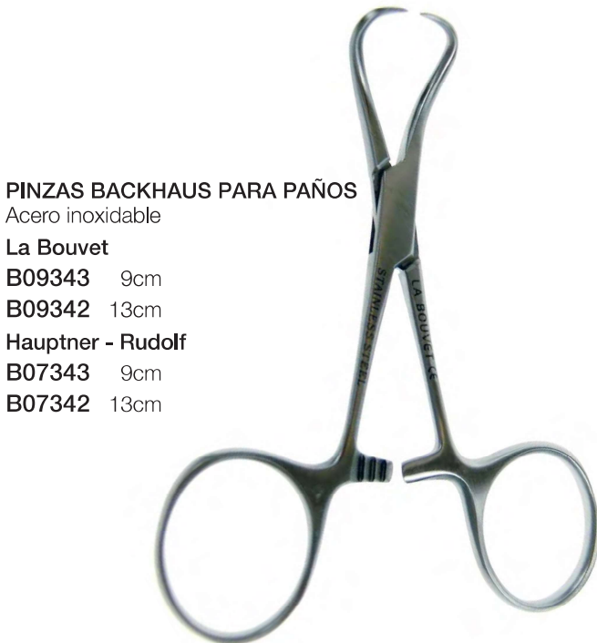
PINZAS BACKHAUS PARA PAÑOS