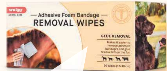
REF 510002378 30 toallitas (12 x 18 cm)