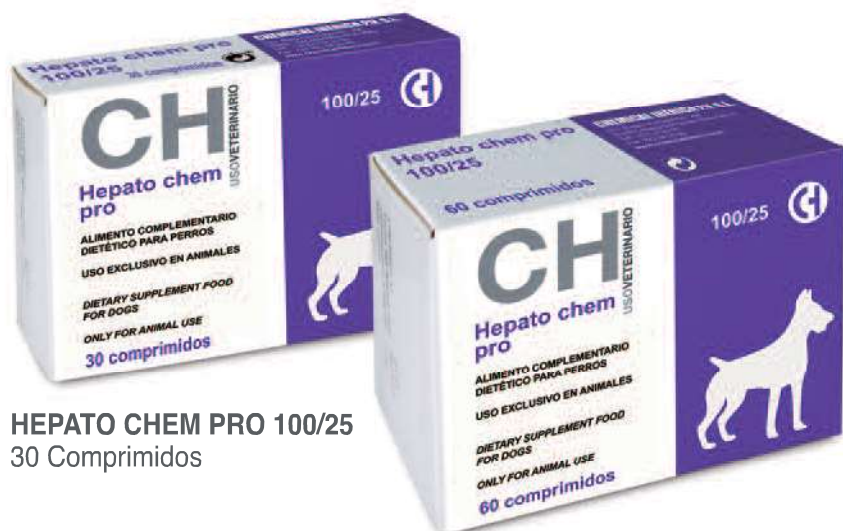
HEPATO CHEM PRO 100/25 30 Comprimidos