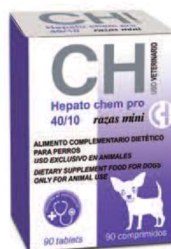
HEPATO CHEM PRO 40/10 Razas Mini 90 Comprimidos