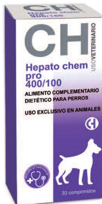
HEPATO CHEM PRO 400/100 30 Comprimidos