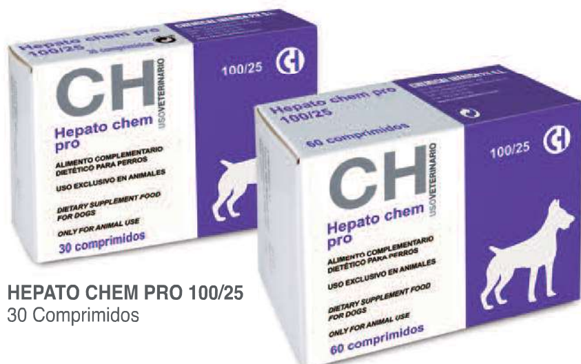
HEPATO CHEM PRO 100/25 30 Comprimidos