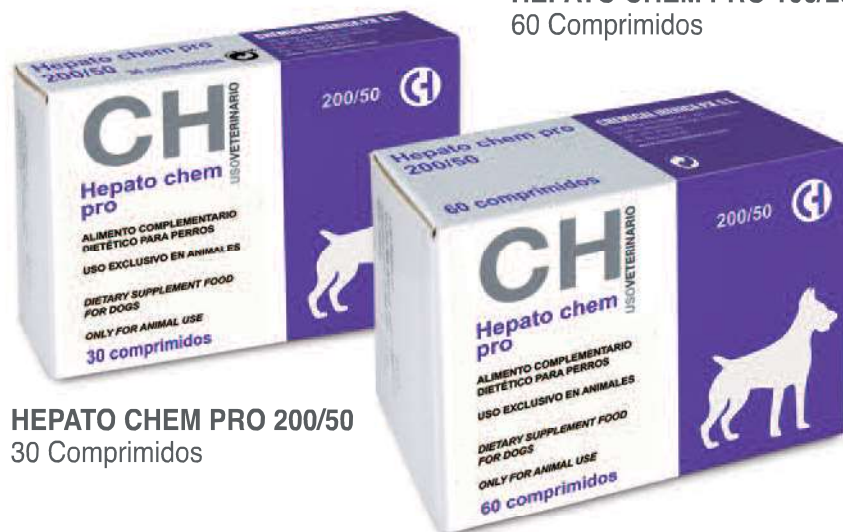
HEPATO CHEM PRO 200/50 30 Comprimidos