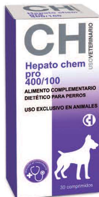
HEPATO CHEM PRO 400/100 30 Comprimidos