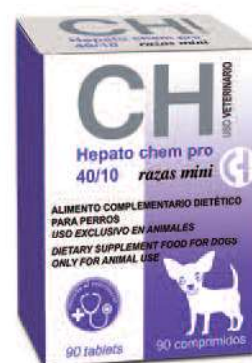
HEPATO CHEM PRO 40/10 Razas Mini 90 Comprimidos